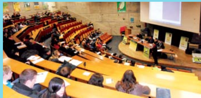
Vue de l'assistance au Séminaire Travail'Vo du 30/11/2010