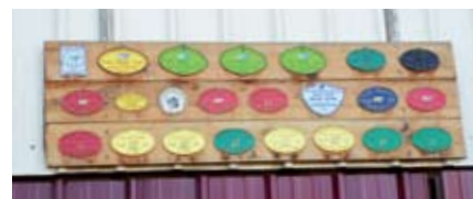
Les plaques de prix reçus dans les concours d'animaux

« Chez nous, nous avons en projet de développer encore le veau sous la mère pour atteindre 50 à 60 veaux vendus par an. Nous avons confiance dans l'avenir de cette production et de ses débouchés, bien entendu à condition de faire la qualité demandée par le marché. Sans hésitation, nous conseillons aux jeunes qui ont une exploitation de taille comparable à la nôtre de s'orienter vers le veau sous la mère plutôt que vers le brotard. Il s'agit bien sûr d'avoir la motivation et de ne pas plaindre son temps passé avec les bêtes. Cependant, pour les jeunes qui veulent s'installer en hors cadre familial, comme nous l'avons fait nous-mêmes, nous nous devons de les avertir sur les difficultés financières et de trésorerie auxquelles ils risquent d'être confrontés au démarrage et pendant plusieurs années ».