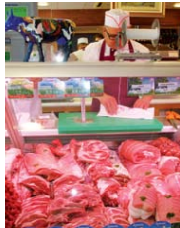
Le veau sous la mère Label Rouge dans la vitrine

« Oui, les ventes sont assez régulières dans l'ensemble : nous débitons entre 1 et 1,5 veaux par semaine, y compris l'été grâce aux estivants qui reviennent au pays et continuent à cuisiner, même en vacances. Nous proposons spécialement à cette période du rôti de veau chaud prêt à consommer, des colis « barbecue » avec un assortiment de morceaux et d'élaborés de veau tels que brochettes, escalopes, tendrons, milanaïses ».