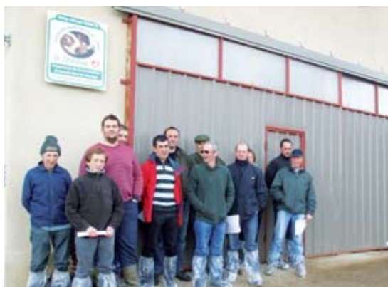
Une partie des éleveurs présents à la journée Travail'Vo du 30/03/2011