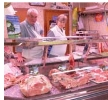
Vue de la vitrine de la boucherie TESTÉ

« La catégorie de carcasses qui nous convient le mieux est le 2U3 (rosé clair, bonne conformation et bon état de finition), même quand elles sont un peu lourdes, jusqu'à 150-160 kg. Ce poids correspond pour nous à l'écoulement d'une demi-carcasse par semaine ».