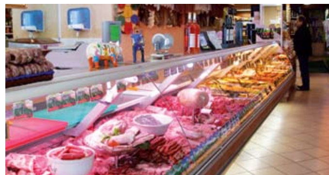
Vue d'ensemble du magasin

« Il pourrait y avoir un bel avenir pour ce métier qui mérite plus que jamais sa place dans l'éventail des commerces : il faut que nous encourageons les jeunes à reprendre le flambeau. Le gros problème est la qualité insatisfaisante des formations proposées pour les futurs bouchers.