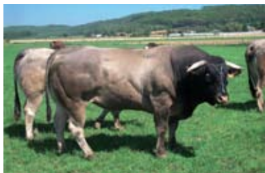
Billard, le taureau Bazadais au milieu du troupeau

« Effectivement, nous sommes ici au pays de la Blonde d'Aquitaine ! Mais la race Bazadaise me plaisait depuis longtemps car, parmi les 1ères vaches que j'ai achetées, il y avait de bonnes taupes croisées Bazadaises x Frisonnes. J'ai acheté une 1ère paire de Bazadaises dans un élevage du Gers de bon niveau génétique, puis j'en ai acheté d'autres, et d'autres encore, un peu partout, là où j'en trouvais ! ».