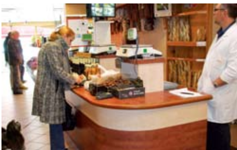
Une clientèle aisée qui ne discute pas le prix

« Nous sommes situés dans un quartier assez chic de la cité Paloise avec une clientèle plutôt aisée et bien répartie dans toutes les classes d'âges. Ainsi, 30 % de nos clients sont des jeunes de 25 à 35 ans. Pour toutes ces raisons, nous proposons un panel très diversifié de produits ».