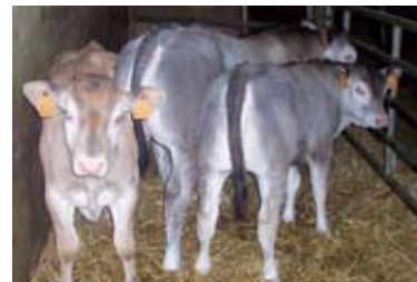
Une case avec de bon veaux

« Je ne me plains pas mais la condition est d'avoir de bons résultats techniques. Je m'efforce de faire vélér toutes mes vaches une fois par an avec des vélages étalés sur l'année. C'est le choix que j'ai fait dans un souci de régularité du travail et de la trésorerie sur l'année. Je fais, dans l'ensemble, des veaux de bonne qualité qui sortent pratiquement tous « blanc » ou « rosé clair » en couleur, bien finis en état de gras et de conformation U pour les Bazadais purs et R pour les veaux de tantes. Je les vends en moyenne à l'âge de 4 mois ½ et à un poids de 125 kg de carcasse. Ce qui donne un prix de vente moyen avoisinant les 1000 € pour les 65 veaux vendus sur les deux dernières années. Je pense que c'est grâce à des productions comme le veau sous la mère que des exploitations comme la mienne peuvent assurer leur viabilité économique ».