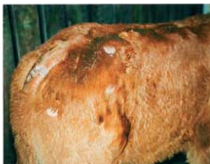
Un veau atteint de teigne

Très volatiles, les spores de ce champignon se propagent rapidement sur tout le corps. D'où le caractère très contagieux de la teigne à la fois pour les veaux et pour les hommes (zoonose). Bien que les veaux atteints ne manifestent pas de démangeaisons, la teigne peut avoir de graves conséquences sur leur croissance, sur la dépréciation de leur qualité de carcasse et de la qualité de leur cuir.