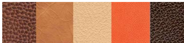
Différents grainages permettant de masquer les cicatrices

Ces peaux abîmées doivent être pigmentées, voire grainées, lorsque le pigment seul ne suffit pas à cacher les défauts les plus grossiers. En 2010, près d'une peau sur deux a présenté un grand nombre de défauts et malgré les efforts des tanneurs, 4 peaux sur 100 ont dû être définitivement écartées du circuit.