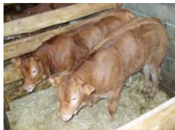
Vue d'une case avec deux bons veaux

selon moi, bien observer, bien surveiller le troupeau et les veaux, les bichonner et s'appliquer à faire la tétée en y consacrant tout le temps nécessaire est très important pour réussir dans cette production. Mais je ne refuse pas pour autant la modernité et les innovations techniques, bien au contraire, cela afin de me simplifier le travail, de gagner du temps et de diminuer ma peine sur les tâches répétitives mais aussi pour pouvoir me libérer de temps en temps »