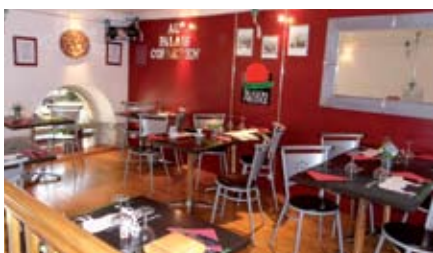
La salle de restauration-dégustation

extérieure du magasin n'est qu'un « amuse-bouche » avant de franchir la porte d'entrée ! A droite en rentrant, la vitrine abondamment achalandée de pièces de viande, de produits élaborés, de plats cuisinés et de conserves fabrication maison, nous tape à l'œil. A gauche, un escalier nous invite à visiter le premier étage. Nous ne nous faisons pas prier ! Et là-haut, nous attend l'inattendu : une petite salle de restaurant lumineuse aux couleurs chatoyantes, meublée « art moderne » et décorée harmonieusement. C'est là que nous nous installons avec René et Sylvie pour faire causerie car tout cela mérite explication !