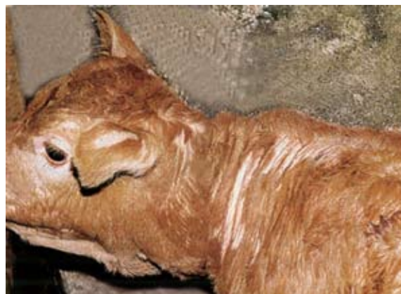
Un veau infesté de poux