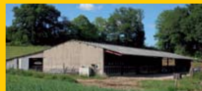
Vue de la stabulation libre

- j'ai supprimé la tétée du dimanche soir dès mon installation : j'en suis très satisfait et je m'en porte bien !