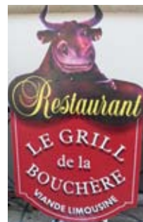
L'enseigne du contrat de licence