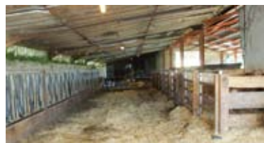
Vue de la salle de tétée actuelle

« Bien sûr ! D'abord, j'ai une marge de progrès très importante à combler sur la qualité des veaux produits, autant sur la conformation bouchère que sur la couleur ou l'état de gras. C'est essentiellement par la voie de l'amélioration du niveau génétique de mon troupeau que je compte y arriver. Ensuite, mon objectif est de passer à 60 veaux produits par an dès 2012, alors que je me situe entre 40 et 50 actuellement.