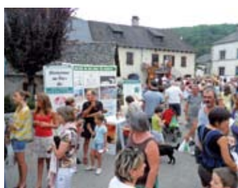
A Monceaux sur Dordogne, le stand de l'Association «noyé» dans la foule