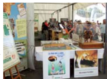
Espace commun AVSLM / Limousin Promotion au Festival de l'Élevage de Brive