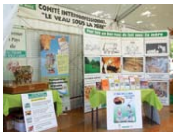
Le stand de l'Association à la ferme en ville à Morlaàs