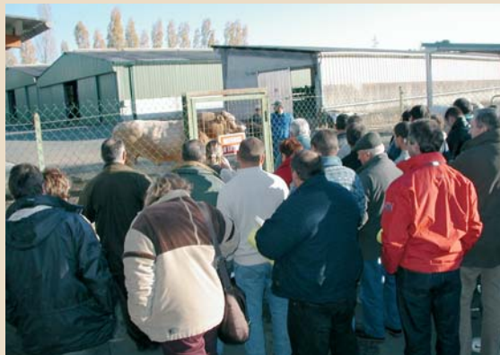
Présentation de taureaux d'I.A. aux éleveurs présents lors d'une journée " Dessaisonnement " dans une Coopérative d'Insémination

• L'automne et l'hiver prochains seront très denses en journées de terrain organisées et animées par le CIVO et ses 23 organisations de producteurs adhérentes. Ainsi, sont prévues :