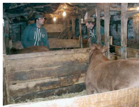
Le salarié d'un groupement d'employeurs au travail chez un éleveur de veaux sous la mère

Nous consacrons quelques pages de ce numéro de "Veau Sous La Mère Actualités" à vous parler (ou vous reparler) des formules d'agriculture sociétaire (le GAEC, l'EARL, la SCEA), de solutions de remplacement et d'entraide (le groupement d'employeurs, la banque de travail) et d'une solution inédite d'allègement de l'astreinte de notre production : la suppression de la tétée du dimanche soir. Les jeunes éleveurs peuvent trouver là des réponses à l'une de leurs aspirations fortes : disposer d'un temps libre et d'une qualité de vie comparables à ceux de leurs contemporains salariés. Ces solutions, dont les enjeux sont toujours en fait