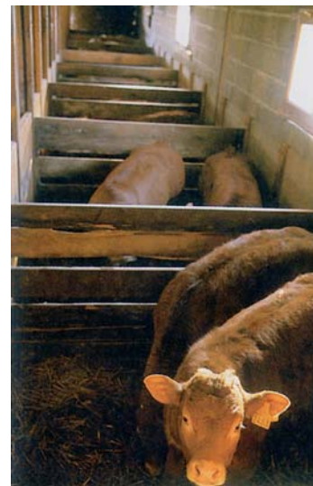
Des veaux bien logés dans des cases collectives confortables

La comparaison du classement des veaux dans les mêmes élevages avant