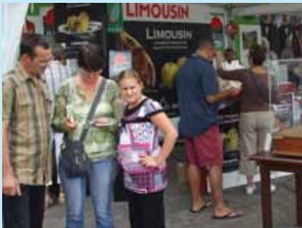
Le stand CREPAL / Limousin Promotion / CIVO au Festival de l'Élevage de Brive

Une table ronde a été organisée en commun par France Limousin Sélection et le CIVO le 29 août dernier à l'occasion du Festival de l'Élevage de Brive sur le thème « Le veau de lait sous la mère : une production à forte valeur ajoutée pour les éleveurs du Limousin ». Les jeunes éleveurs présents ont insisté sur les nombreux atouts de cette production tels que garantie de débouchés rémunérateurs et revenu stable dans le temps mais aussi sur le fait que des solutions efficaces d'allègement du travail et de l'astreinte sont disponibles pour ceux qui veulent bien se les approprier. Précisément, un programme ambitieux d'aide des éleveurs de veaux sous la mère à l'adoption de ces solutions va démarrer dès ce début d'année 2009, à l'initiative du CIVO.