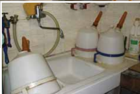
Une zone de préparation du complément lacté propre et bien rangée

Ces différentes erreurs dans les pratiques peuvent être à l'origine tantôt de diarrhées, tantôt d'indigestions, tantôt de blocages digestifs chez les veaux avec, en conséquence, des croissances, des indices de consommation et un état d'engraissement non satisfaisants.