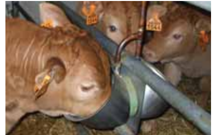
Buvée dans un abreuvoir en inox spécial veaux de boucherie

- sachant que, par temps chaud, les veaux ont tendance à solliciter davantage les abreuvoirs à l'approche de la tétée (surtout celle du soir), il peut être utile de couper l'alimentation en eau au moins deux heures avant la tétée afin d'éviter que les veaux se gavent d'eau, ce qui peut avoir pour conséquences une ingestion plus faible de lait à la tétée mais aussi une perturbation de la coagulation et de la digestion de ce lait dans la caillette. A cet effet, l'idéal serait d'installer une électrovanne reliée à une minuterie. Sinon, en l'absence d'abreuvoirs, la solution est d'apporter de l'eau aux veaux en milieu de journée soit dans un seau soit plutôt au biberon disposé sur la porte ou la barrière de la case, entre 1 m et 1,20 m de hauteur.