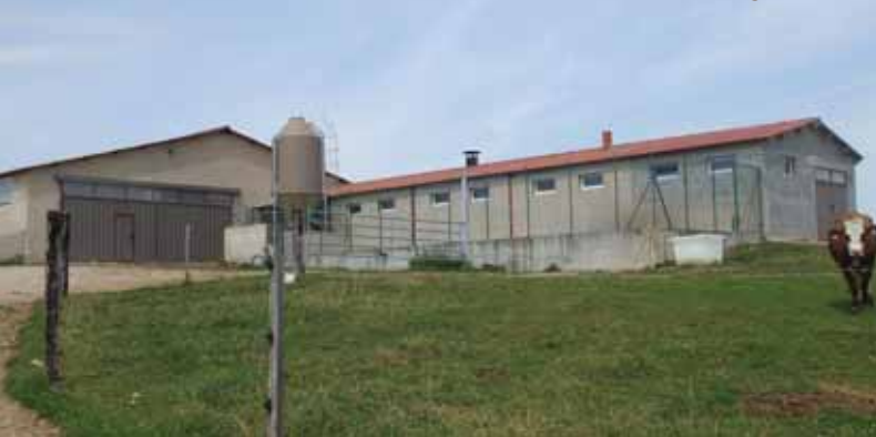
Les bâtiments d'élevage d'Eric