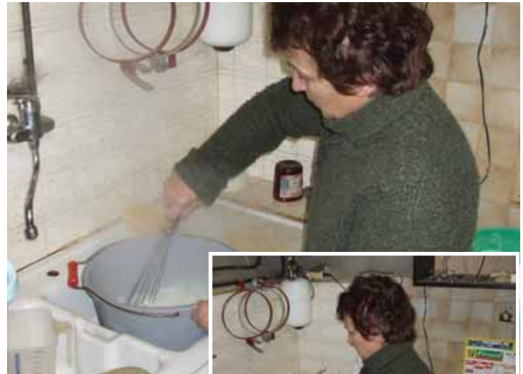
La préparation du complément lacté

→ Concentration recommandée en poudre lactée : de 120 g au minimum jusqu'à 200 g au maximum par litre de complément distribué (soit 5 à 8 litres de lait préparé pour 1 kg de poudre lactée) suivant l'âge, le stade de finition du veau, la composition de la ration des mères (incidence sur la richesse du lait maternel) et leurs niveau et stade de production laitière.