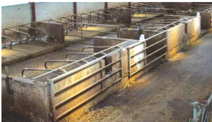
L'intérieur de la stabulation libre à logettes

« Je dois dire, avant toute chose, que je ne « pleure » pas le temps que je passe auprès de mes bêtes car j'aime beaucoup vivre auprès de mes animaux et, de plus, je suis passionné par cette production de veaux sous la mère. Lorsque nous voulons partir quelques jours, je sollicite soit le service de remplacement (je n'en suis pas mécontent !), soit des amis ou mon neveu. Bien sûr, pour partir tranquille, je prends soin de tout noter par écrit en vue de faciliter le travail du remplaçant : par exemple, je note les couples mères-veaux et tantes-veaux, l'ordre de tétée des veaux lors de chacun des 2 ou 3 services de tétée, les problèmes spécifiques du moment sur les veaux ou sur les mères, les vaches proches du terme qui sont à surveiller. De plus, je tiens à ce que mon remplaçant soit présent aux deux tétées qui précèdent mon départ. Je pense que c'est grâce à cette préparation que les choses se sont toujours bien passées jusqu'à présent ».