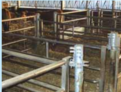
Le dispositif de tétée en libre service de l'élevage BEYSSERIE

Producteur de veaux de lait en Corrèze, Pierre Beysserie a opté pour un système de tétée en libre service mais uniquement pour la période de démarrage des veaux jusqu'à l'âge de 2 mois - 2 mois 1/2. La phase de finition des veaux est conduite de façon classique en salle de tétée.