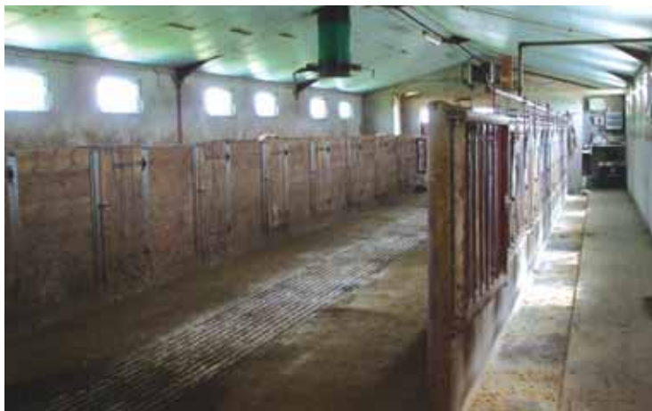
L'intérieur de la salle de tétée équipée d'un aérotherme et d'un extracteur