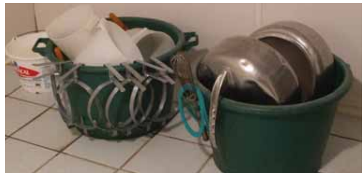
Vaisselle rangée après un lavage impeccable

- Lavage complet du matériel de préparation et de distribution à l'eau chaude et légèrement javellisée, égouttage et rangement sur des supports prévus à cet effet, à l'abri des mouches et de la poussière.