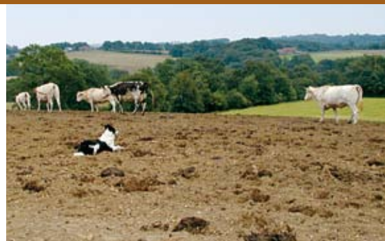
Le chien de troupeau, un bel « outil » de manipulation et de contention du troupeau

• n'hésitez pas à enlever du troupeau un animal trop farouche, agressif, récalcitrant ou perturbateur (ex : vache très dominante).