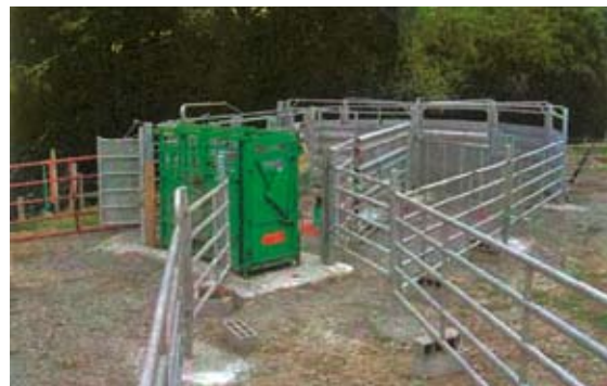
Un système de contention bien conçu pour la sécurité et le confort de travail de l'éleveur travaillant seul