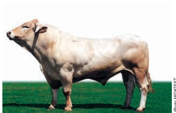
Un taureau Blond d'Aquitaine d'insémination agréé "Viande + Elevage" à bonne aptitude laitière (LANDAIS)

• de vaches ayant un bon index "Allaitement" (ALait) ainsi qu'un index et une note de développement musculaire (DM) largement positifs. Pour cela, les éleveurs fournisseurs doivent bien sûr être adhérents au contrôle de performances et vous devez absolument consulter les fiches de la mère et du père.