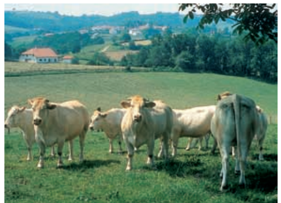
Ne laissez pas trop vieillir votre troupeau

On conseille de ne pas dépasser l'âge de 9-10 ans pour la réforme, soit après 6 ou 7 vêlages. Cependant, la réforme mérite d'être raisonnée vache par vache. Une mauvaise vache est toujours réformée trop tard alors qu'une bonne vache gagne à être conservée un peu plus longtemps (mais pas au-delà de l'âge de 13-14 ans). Cela correspond à un taux de réforme de 15 à 20% par an. Si l'effectif du troupeau est stable, c'est aussi ce taux de 15 à 20 % qu'il faut viser pour le renouvellement du troupeau.