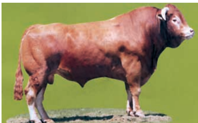
Un taureau d'insémination Limousin agréé "Viande + Elevage" à bonne aptitude laitière (HIGHLANDER)

Exemples de taureaux testés ayant un bon index "Production laitière" (PLAIT) :